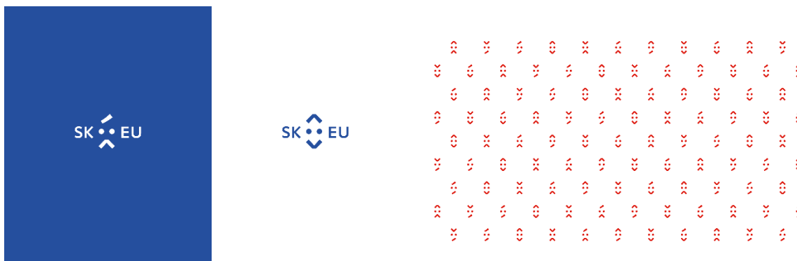
Obr. 5/ Logo a vizuálna identita predsedníctva SR v Rade EÚ (autor: Jakub Dušička)

Cena SRK za umenie – http://www.srk.sk/projekty/cenasrkumenie?lang=sk